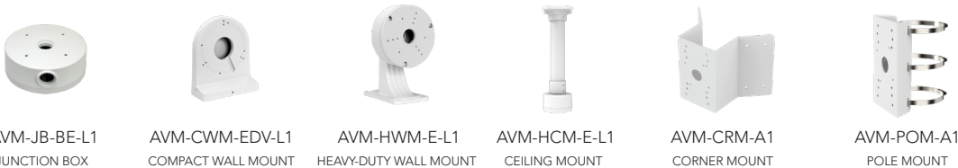
AVM-JB-BE-L1 JUNCTION BOX